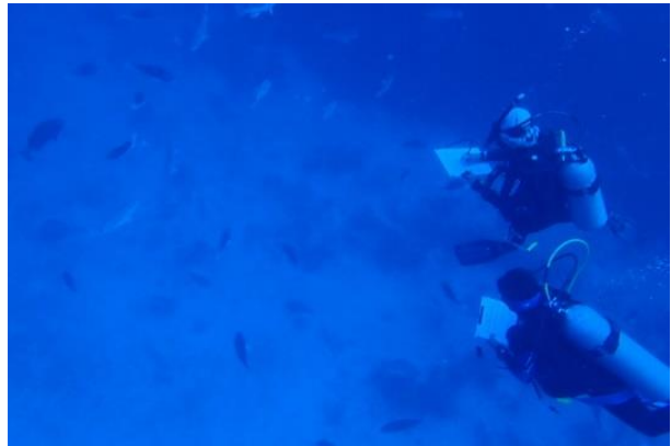
Figura 6 Buzas registrando datos en una agregación de Epinephelus striatus.

Los censos visuales subacuáticos (CVS) permiten a los investigadores identificar especies y cuantificar la abundancia y el tamaño de los peces en los sitios de agregación de desove ubicados dentro de los límites seguros de buceo. Los CVS se pueden usar para verificar los tiempos y lugares de la agregación, documentar el cortejo y el comportamiento de desove, y evaluar los patrones de uso cambiante del sitio.