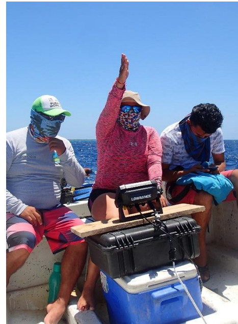
Figura 4 Pescadores e investigadores realizando transectos de batimetría.

La geomorfología de los sitios de agregación de desove suele ser parecido, es decir, las especies prefieren características y condiciones estructurales específicas cuando se agregan (Erisman et al. 2018). Algunas características comunes son profundidades que van de 20 a 40 m, cerca del borde del cantil (aguas profundas) y sobre pináculos submarinos (codos) en el arrecife. Esta información puede ser valiosa para buscar y localizar eficientemente los sitios de desove. El costo de generar mapas batimétricos es muy variable y depende en gran medida del equipo utilizado. Describimos un método de bajo costo.