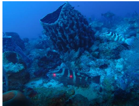
Figura 8 Un mero Nassau con los puntos láser en su cara lateral. Los fotogramas son extraídos de las grabaciones y son usados para hacer el cálculo de la talla del pez.