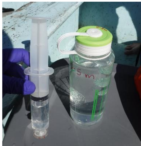
Figure 9 Muestras de agua con eDNA.

La genética puede proporcionar información importante para la gestión de la pesquería. En los sitios de agregación de desove, la genética puede proporcionar información sobre conectividad entre sitios, fuentes y sumideros de larvas, salud de la población y desplazamiento de larvas de áreas determinadas (Burgess et al. 2014). Los estudios genéticos requieren la recolección de muestras de tejido en los sitios de aterrizaje. Los peces en peligro presentan un problema ya que las existencias son bajas y las capturas pueden ser poco frecuentes o prohibidas. Las ARP representan una oportunidad única para recolectar muestras de ADN sin causar impactos negativos en la población.