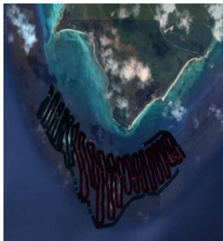
Figura 5 Ejemplo de transectos para levantar datos batimétricos (Crédito: COBI).