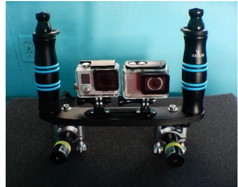
Figura 7a Equipo de laser