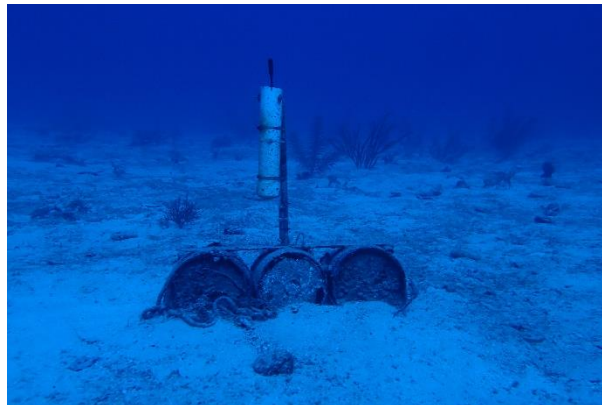
Figura 10 Hidrófono instalado en un sitio de desove.

Algunos peces emiten sonidos durante el cortejo y el desove. Los hidrófonos submarinos se han utilizado para registrar dinámicas espaciales y temporales de especies agregadas (Heyman et al. 2017). Los hidrófonos suelen ser instrumentos ubicados en estaciones fijas en el sitio de agregación y se consideran un método de monitoreo pasivo. La autonomía de los hidrófonos ofrece ventajas sobre un programa de monitoreo visual. Dependiendo de la configuración, la carga de la batería y el espacio de almacenamiento, pueden operar de uno a 180 días. Los hidrófonos submarinos monitorean constantemente las áreas de desove a lo largo del año y solo necesitan cambios de batería y descargas de información. Los receptores acústicos pasivos pueden convertirse en un componente clave del monitoreo a largo plazo de los sitios de agregación de desove de peces (Schärer et al. 2012) ya que permiten el monitoreo durante todo el año.