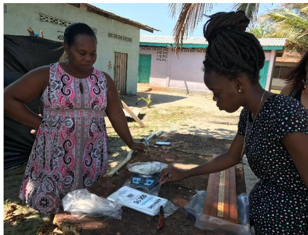
Figura 2 Científicas comunitarias monitoreando desembarcos.

Las agregaciones reproductivas de peces (ARP) son muy vulnerables a la sobreexplotación ya que los pescadores se benefician económicamente de su previsibilidad y las grandes cantidades de biomasa que concentran (Sadovy y Domeier 2005). Es por ello que el monitoreo de desembarcos nos provee un mecanismo económico para conocer el estado de los stocks pesqueros de las especies en agregación (Graham et al. 2008). El monitoreo de desembarcos nos permite coleccionar información sobre el esfuerzo pesquero, costos de la pesca y la biología de la especie (datos biométricos y reproductivos).