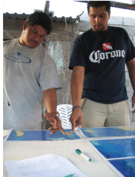
Figura 1 Identificando sitios potenciales en el mapa.

En el proceso de “descubrir” 2 e investigar los sitios de agregaciones reproductivas de peces (ARP), la documentación del CET es generalmente el primer paso (Hamilton et al. 2012). Posteriormente la información debe ser validada en el sitio a través del buceo autónomo u otra metodología, idealmente involucrando a los mismos pescadores como científicos ciudadanos 3 (Fulton et al. 2018).