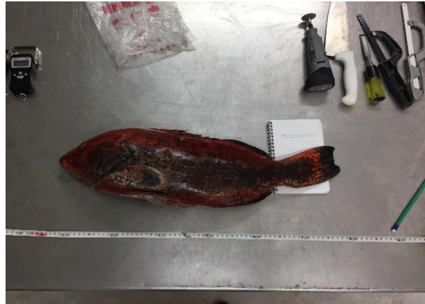
Figura 3 Muestreo de tejido.

Muchas especies de peces comerciales migran largas distancias para agregarse y desovar en lugares y momentos específicos en los arrecifes cada año. En la mayoría de los casos, los pescadores locales son los primeros en identificar estos sitios (Heyman y Kjerfve 2008) y/o pescar el sitio de agregación o las rutas de migración. Los programas de monitoreo pesquero son herramientas efectivas para recolectar información biológica sobre especies clave (ver Protocolo 2). Estos programas incorporan el conocimiento ecológico tradicional, involucrando a pescadores capacitados en la recolección de datos e involucrando a la comunidad en la toma de decisiones para manejar los recursos (Ramírez-Valdez et al. 2017).